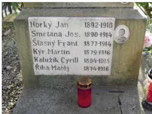
Pomník padlým v první světové válce v Hruškách a detailní pohled na desku se jménem Martina Kýra tamtéž | Foto: Michal Schuster, 2018