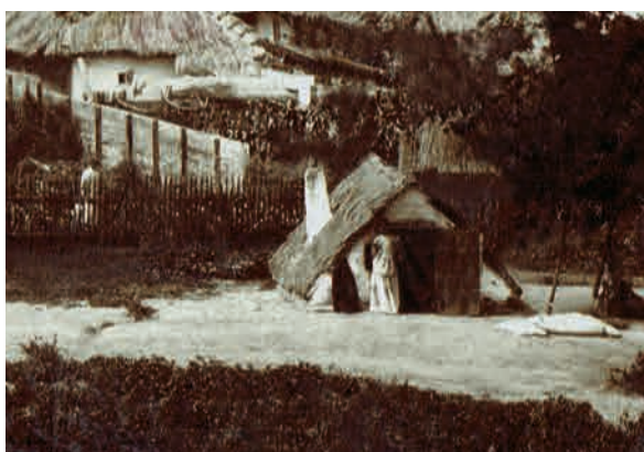
Obydlí rodiny Kýrů na výřezu z fotografie obce Hrušky, 1897