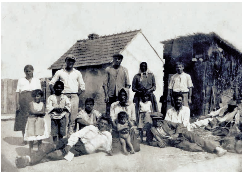
Bliže neurčení lidé před domem Josefa Dychy v Hruškách v části Na zahájce, asi 1934–1943