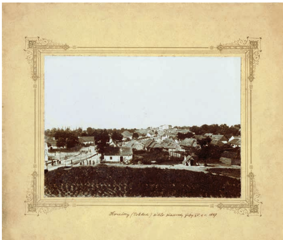
Pohled na Hrušky od železničního náspu, vpravo v popředí obydlí rodiny Kýrů. Pod fotografií je popiska „Hrušky (Pohled) sídlo předsedy župy XV. v r. 1897“