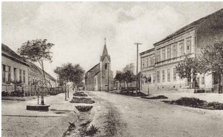
Kostel sv. Bartoloměje a obecná škola (vpravo) v Hruškách, první polovina 20. století