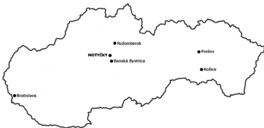
Lokalizácia obce Motyčky na mape Slovenska | Autor: Arne B. Mann

Obec Motyčky sa nachádza v západnej časti Nízkych Tatier, 21 kilometrov severne od Banskej Bystrice, popri ceste č. I/59 smerom na horský prechod Donovaly, v nadmorskej výške 678 m n. m. Vznikla v roku 1860 spojením