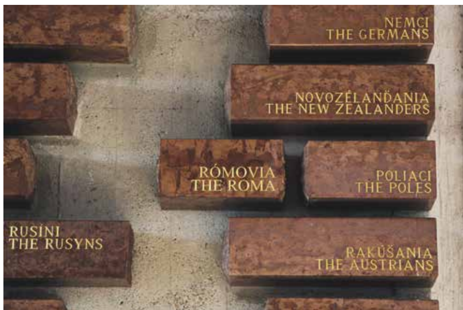
Obr. 1: Kameň v Pietnej sieni Múzea SNP, ktorý dokladuje aktívnu účasť Rómov v SNP

V roku 2005 boli odhalené aj pamätničky v obci Lutilla (zavraždených 44–46 Rómov) a pamätník v obci Nemecká (expozícia obetí zavraždených na masovom popraviske v Kremničke a vápenke v Nemeckej). Pamätná tabuľa na železničnej stanici v Hanušovciach nad Topľou (odhalená v roku 2006) pripomína rómske obete v pracovných útvaroch. Pamätníky na židovskom cintoríne vo Zvolene a cintoríne v obci Slatina (oba z roku 2006) sú na mieste masových hrobov zavraždených Rómov. Rovnako bol v roku 2007 odhalený pamätník na mieste masovej popravy 26 Rómov v Dubnici nad Váhom (Kumanová 2014: 39–40). Autormi pamätníkov boli profesionálni výtvarníci, kovové súčasti vytvorili rómski umeleckí kováči z Dunajskej Lužnej a Bolešova.