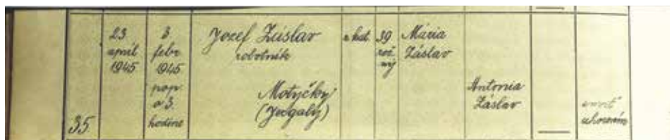
Obr. 6: Záznam v matrike úmrtí v Starých Horách