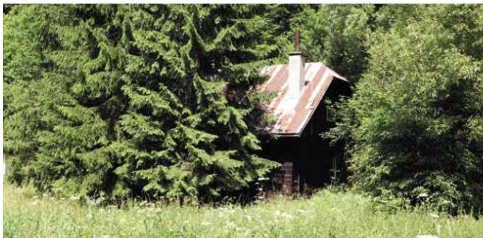
Obr. 4: Opustená drevorubačská koliba

Výpoveď pána Môcika potvrdzujú aj archívne pramene, ktoré sa nachádzajú v Múzeu Slovenského národného povstania v Banskej Bystrici. 13 Z 12. apríla 1959 je záznam o Revolučnom národnom výbore v Motyčkách počas SNP, v ktorom sa uvádza: „Dňa 2. februára 1945 [...] Vtedy upálili zaživa aj asi 11 Židov, ktorých esesáci chytili v bunkeroch a odviekli do spomínanej lesnej chaty v osade Štubne. Týchto nahnali do chaty, zatvorili. Chatu poliali horľavinou a zapálili.“ 14