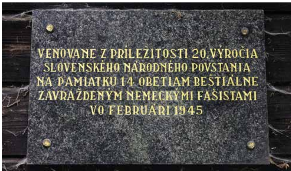
Obr. 5: Pamätná tabuľa na drevorubačskej kolibe